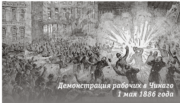
Демонстрация рабочих в Чикаго 1 мая 1886 года

В этом году Первомая отметит 140-летие. История Первомая как праздника трудящихся связана с трагическими событиями. 1 мая 1886 года в американском городе Чикаго прошла первая массовая демонстрация рабочих, в которой приняли участие от 30 до 40 тысяч человек. Они требовали сократить 15-часовой рабочий день до восьми часов в сутки и выделить два официальных выходных в неделю. «Восемь часов на работу. Восемь часов на отдых. Восемь часов на то, что мы хотим!» – лозунг участников забастовок в США 1 мая 1886 года