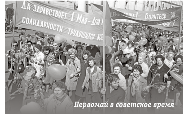
Первомай в советское время

В 2014 году профсоюзы провели первое в современной России массовое шествие, оно состоялось во многих городах страны. С тех пор традиция с Первомайскими акциями начала постепенно возрождаться. В рамках празднования 1 Мая рос-