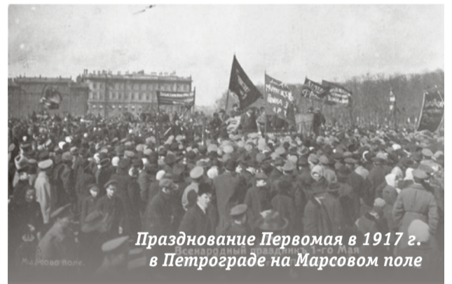
Празднование Первомая в 1917 г. в Петрограде на Марсовом поле

В Российской империи первомайский пикет в первый раз прошел в 1891 году. Под Петербургом почти 200 человек под руководством социал-демократа